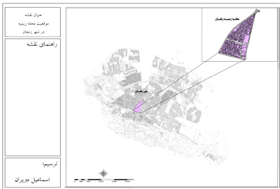
شکل ۲- محدوده مورد مطالعه